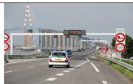
Voie réversible du pont de St-Nazaire

Les personnes interrogées reconnaissent tout l'intérêt de la GDV, eu égard aux résultats performants des expériences étrangères, même si elle est très peu connue et utilisée aujourd'hui en France. Elle est un moyen d'optimiser l'infrastructure existante pour différents critères, notamment la capacité pour tous les véhicules, ou de favoriser la circulation de certains usagers (comme les transports en commun ou le co-voiturage) pour réduire l'auto-solisme. Ce dispositif permet de retarder, voire de se substituer à une solution plus coûteuse comme un élargissement d'infrastructures ou la création d'un axe complémentaire.